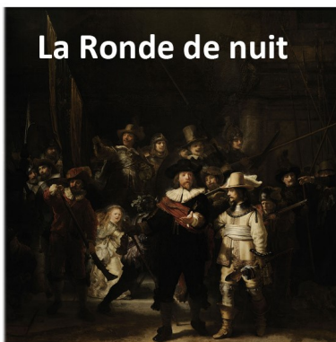
La Ronde de nuit