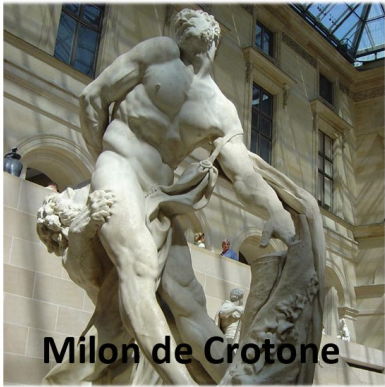
Milon de Crotoné