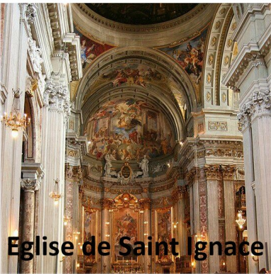
Eglise de Saint Ignace

Bibliothèque de Wiblingen Allemagne 1715.1725