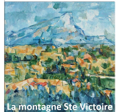
La montagne Ste Victoire