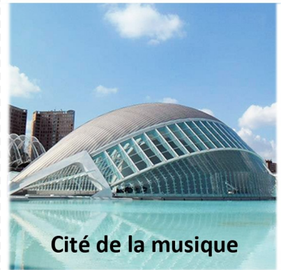
Cité de la musique

Escalier du château d'Augustusburg Brühl Balthasar Neumann 1743.1748