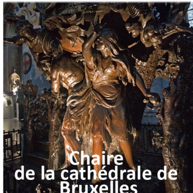
Chaire de la cathédrale de Bruxelles

L'enlèvement de Proserpine Le Bernin 1621.1622