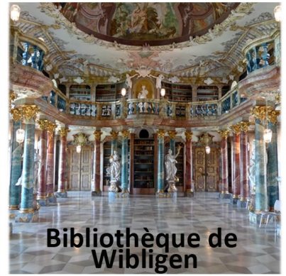
Bibliothèque de Wiblingen