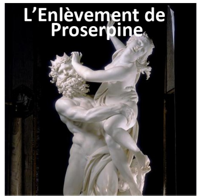
L'Enlèvement de Proserpine

El Transparente, Tolède, cathédrale Narcisso de Tomé 1723.1732