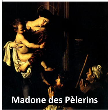
Madone des Pèlerins