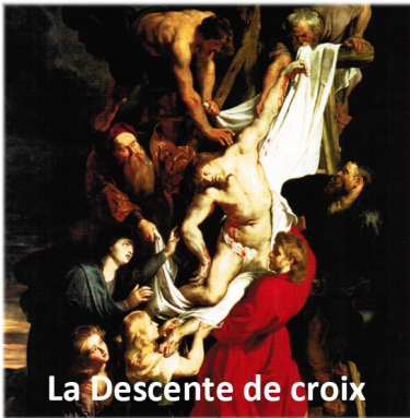
La Descente de croix