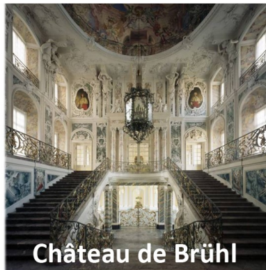
Château de Brühl